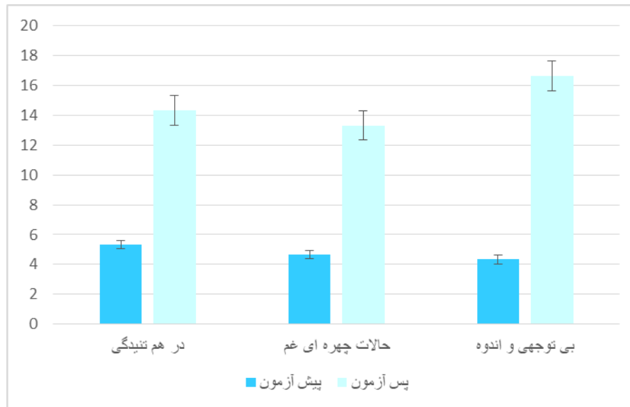
نمودار ۳. میانگین افسردگی شامپانزه‌ها در پیش آزمون و پس آزمون.