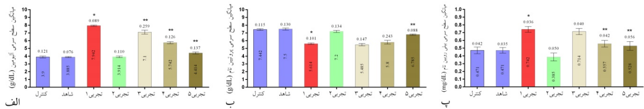
شکل ۲. مقایسه میانگین و انحراف معیار از میانگین سطوح سرمی آلومین (الف)، پروتئین تام (ب)، GGT (پ) و بیلی روبین تام (پ) در گروه های مختلف. *: در مقایسه با گروه های کنترل و شاهد. **: در مقایسه با گروه تجربی ۱.

دارو مستقل از دوز رخ می دهد اما ممکن است برخی جنبه های وابسته به دوز نیز وجود داشته باشد زیرا آسیب کبدی ناشی از دارو تمایل دارد در دوزهای متوسط و بالا رخ دهد (Friedrich et al. , 2016).