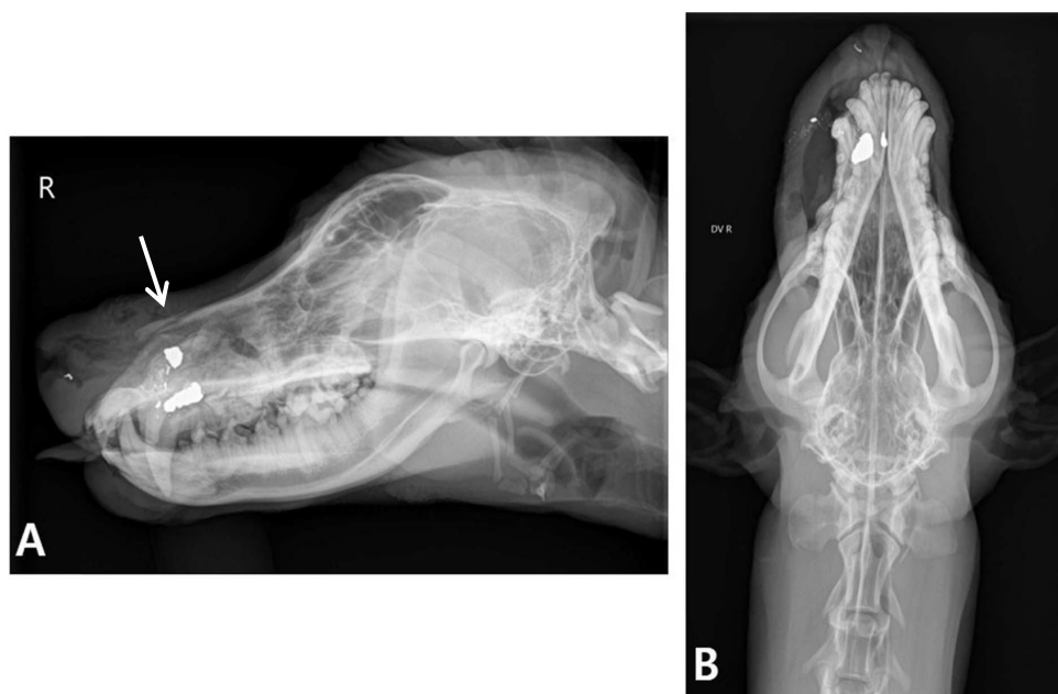
جدول ۲. یافته‌های بالینی و سونوگرافی حاصل از مطالعه ۲۰ بیمار با آسیب‌های احتمالی بینی ( p=۰/۰۵ )

شکل ۱. تصاویر رادیوگرافی از یک قلاده سگ نژاد مخلوط با سابقه آسیب بینی و مشکوک به شکستگی استخوان بینی. A و B. به ترتیب نماهای جانبی و پشتی - شکمی. فلش نشانگر وجود شکستگی در استخوان بینی است. تورم و تجمع گاز در بافت نرم و وجود دو ساچمه فلزی در ناحیه فک بالا همراه با جابه‌جایی قدامی نیم فک پایینی سمت راست و وجود شکستگی در استخوان فک بالای سمت راست، مشهود هستند. شکستگی استخوان بینی در نمای پشتی-شکمی به دلیل خاصیت روی هم قرارگیری استخوان‌های مجامه، قابل رویت نیست.