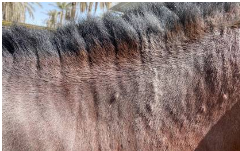
شکل ۴. سارکوئید بر روی گردن. توده های برجسته سفت بر روی سطح پوست. عدم ریزش مو هم مشاهده می شود.

با توجه به سابقه گله و جدا شدن انگل، دو مورد از این اسب ها مشکوک به اکسیوریس اکوئی تشخیص داده شدند که حیوانات آلوده در ناحیه زیر دم و مقعد دچار مورخستگی شده بودند. در این مطالعه دو مورد سارکوئید مشاهده شد که در یک مورد سارکوئید فلت و یک مورد سارکوئید ندولار تشخیص داده شد. در مورد اول ضایعه به صورت تخت و