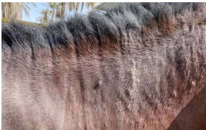
شکل ۴. سارکوئید بر روی گردن. توده های برجسته سفت بر روی سطح پوست. عدم ریزش مو هم مشاهده می شود.

با توجه به سابقه گله و جدا شدن انگل، دو مورد از این اسب ها مشکوک به اکسیوریس اکوئی تشخیص داده شدند که حیوانات آلوده در ناحیه زیر دم و مقعد دچار مورخستگی شده بودند. در این مطالعه دو مورد سارکوئید مشاهده شد که در یک مورد سارکوئید فلت و یک مورد سارکوئید ندولار تشخیص داده شد. در مورد اول ضایعه به صورت تخت و