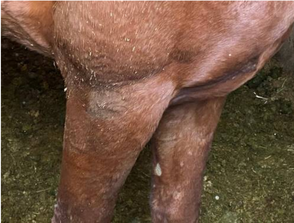
شکل ۲. پتی ریازیس بر روی پاها. وجود ریزش مو به همراه پوسته پوسته شدن پوست.