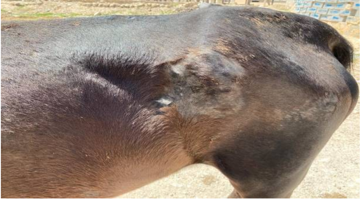
شکل ۱. درماتوفیتوز: ایجاد کراست، ریزش مو به همراه زخک ناشی از مالیدن بدن به اجسام سخت.